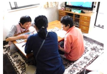
楽しみにしている看護師さんの訪問。心配ごとについて、たくさん話を聞いてもらい安心されている利用者さんもいます