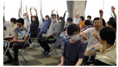
盛り上がりつつも、終始和やかな雰囲気での音楽活動でした