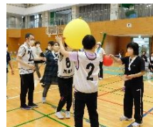
「みんなであつなごう!」