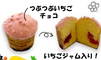
つぶつぶいちごチョコ