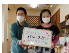
パン工房カラコロ