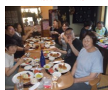
ケアホームあんも マイマイHOUSE