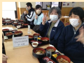
姫路おでんなど兵庫の名物を堪能しました