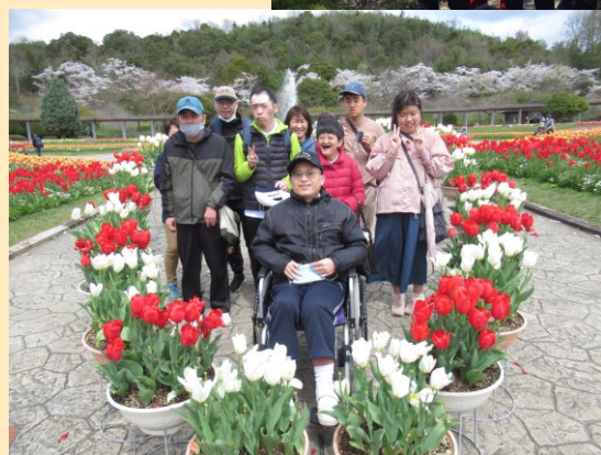
くりえいと 春の外出 兵庫県立フラワーセンターにて