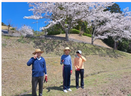
でんでん虫の家 除草作業後のひとコマ