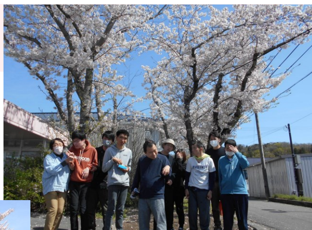
あっと とどろき荘前にて