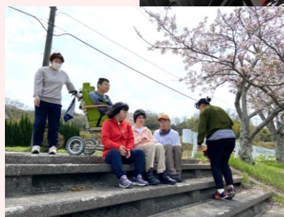
いつもの散歩道 今年もみんなで きれいな桜を楽しみました