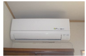
リビング2台 居室5台

5月25日(土) 両日とも 5月26日(日) 10:00～16:00 社中央公園 ステラパークにて クッキー・パン・ラスク コロッセを販売いたします ♪ ぜひ遊びにきてね！