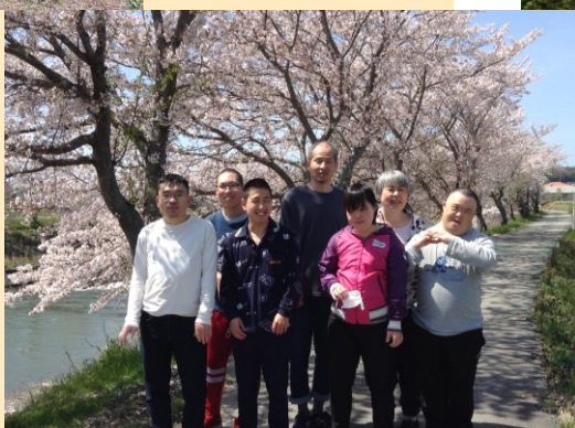
パン工房カラコル 東条川沿いの桜とともに