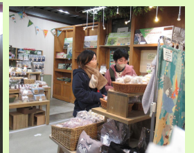
楽しみにしていた限定プリクラやお土産コーナー