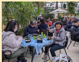
みんなで食べるお弁当は最高！