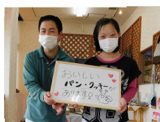
パン工房カラコル