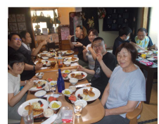
ケアホームあんも マイマイHOUSE