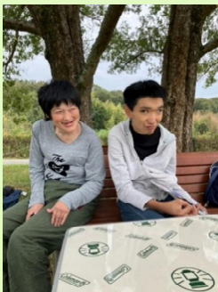
小野市の山田の里公園にて