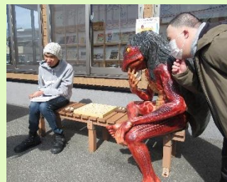
福崎町辻川観光交流センターにて