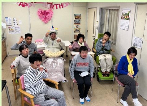
手作りケーキで皆で誕生日をお祝いしました