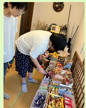
「空くう」でランチの後、駄菓子を選んで購入しました