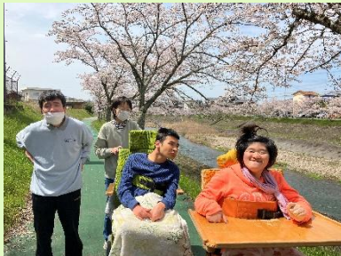
東条川沿いでお花見